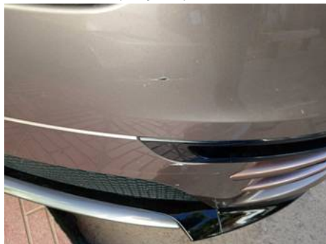
Bouclier avant (Rayure)