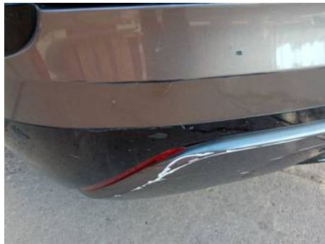
Bouclier arrière (Rayure)