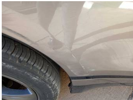
Porte arrière droite (Rayure)