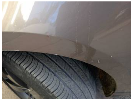
Aile avant gauche (Rayure)