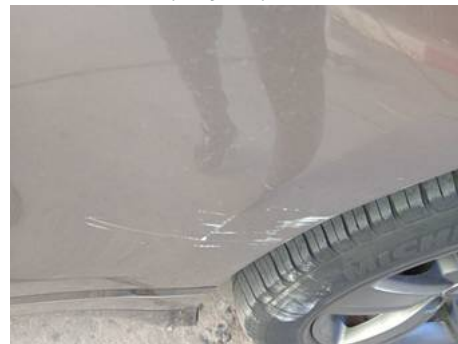
Porte arrière gauche (Rayure)