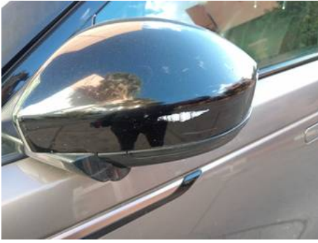
Rétroviseur extérieur gauche (Rayure)