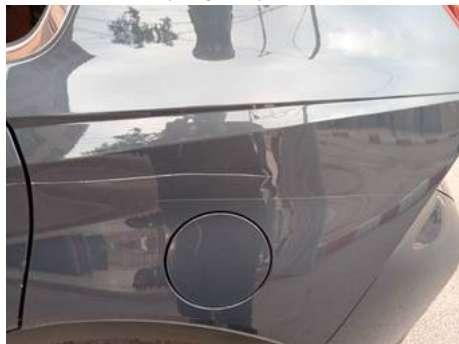
Porte arrière gauche (Rayure)