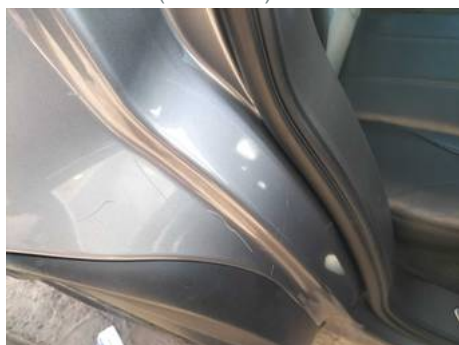
Aile arrière droite (Peinture)