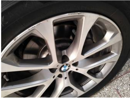
Jante alliage avant gauche (Rayure)