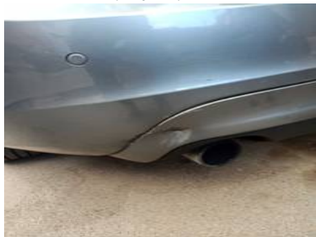
Bouclier arrière (Rayure)