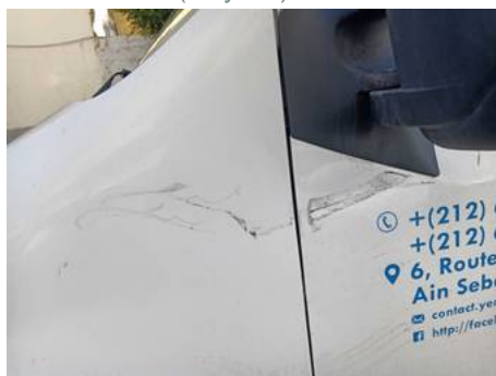
Aile avant gauche (Rayure)