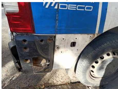
Aile arrière droite (Rayure)