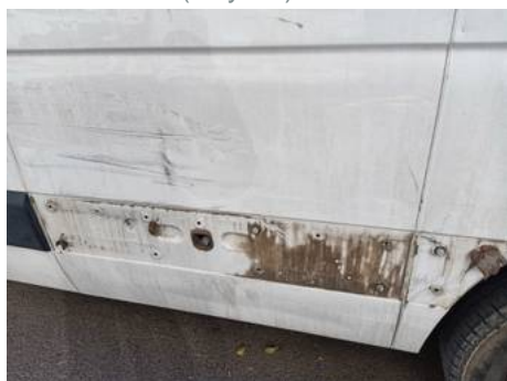
Aile arrière gauche (Rayure)