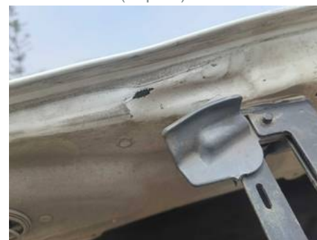
Bouclier avant (Impact)