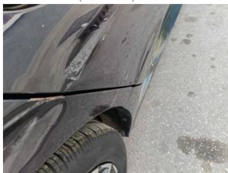
Porte arrière droite (Peinture)