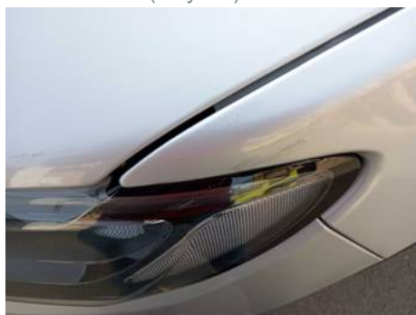
Aile avant gauche (Rayure)