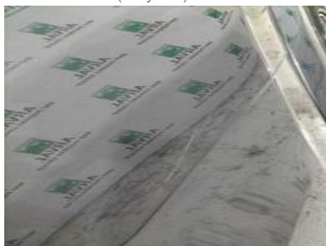
Aile arrière droite (Rayure)