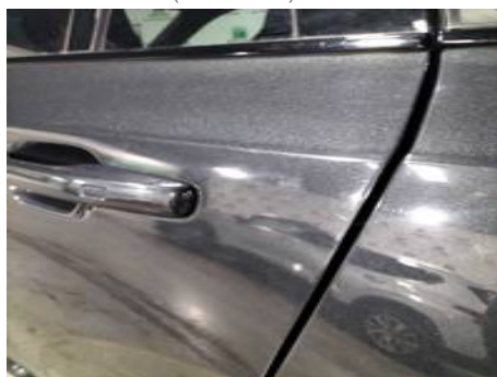
Porte arrière gauche (Peinture)