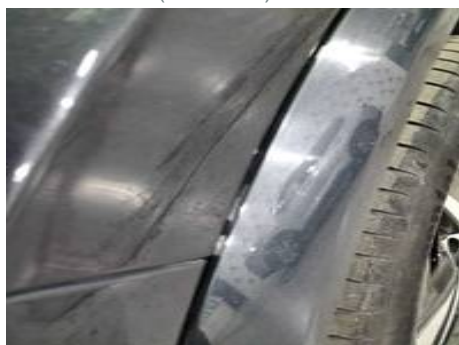
Aile avant gauche (Peinture)