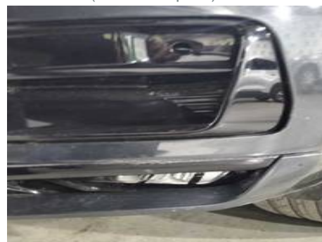
Bouclier avant (Défaut aspect)