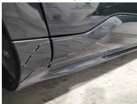
Porte arrière droite (Défaut aspect)