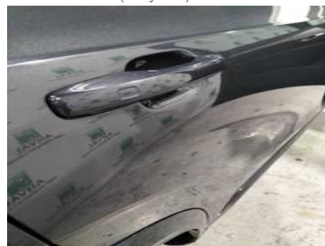
Porte arrière droite (Rayure)