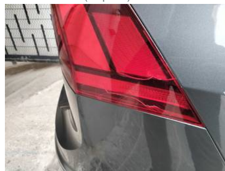
Phare arrière droit (Impact)