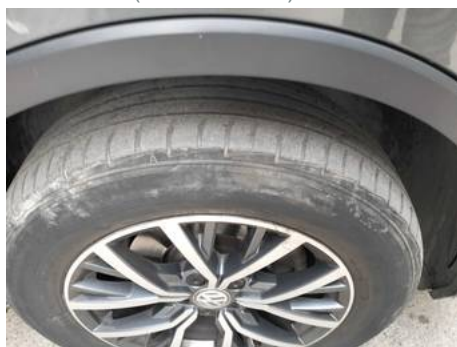
Pneu avant droit (Usure 100%)