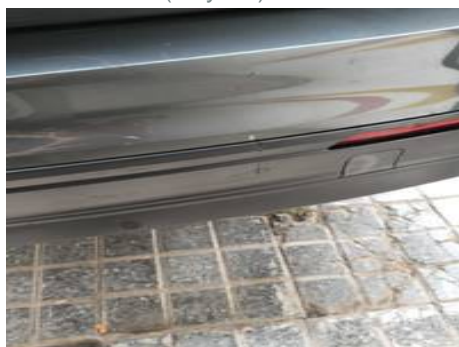
Bouclier arrière (Rayure)