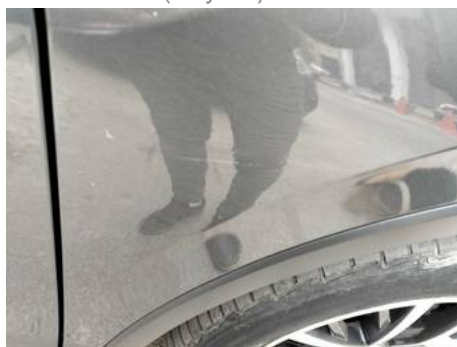
Aile avant droite (Rayure)