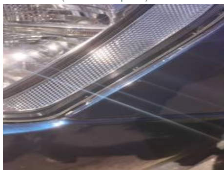
Aile avant gauche (Défaut aspect)