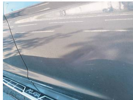
Porte avant droite (Impact)