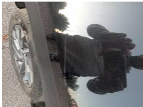
Aile avant gauche (Rayure)