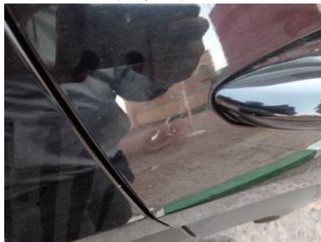
Porte arrière droite (Rayure)