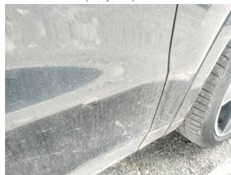
Porte avant droite (Rayure)