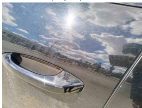
Porte avant gauche (Rayure)