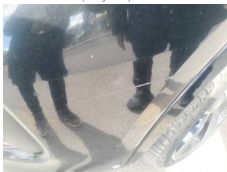
Bouclier avant (Rayure)