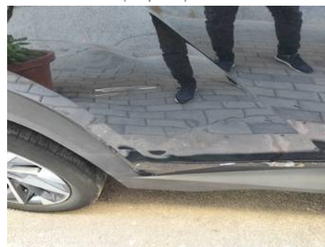
Porte arrière droite (Impact)