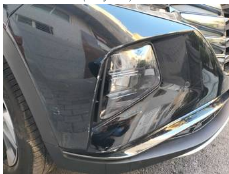
Bouclier avant (Rayure)