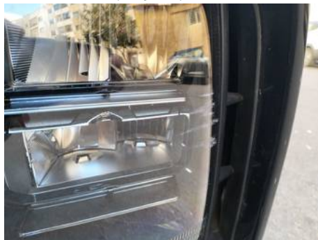
Phare avant gauche (Rayure)