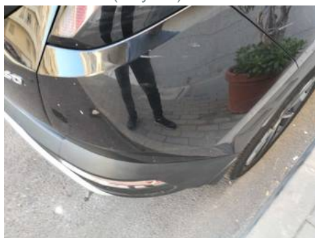
Bouclier arrière (Rayure)