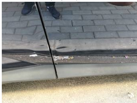
Porte avant droite (Impact)