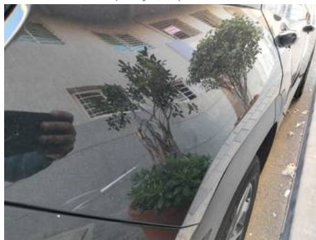
Aile arrière droite (Rayure)