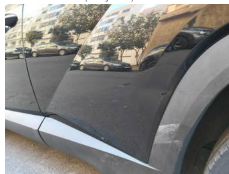
Porte arrière gauche (Rayure)