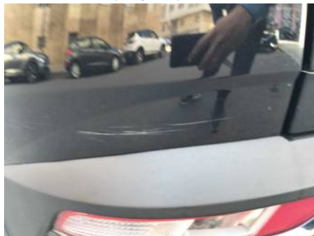
Aile arrière gauche (Rayure)