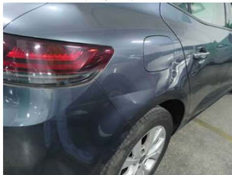
Aile arrière droite (Rayure)