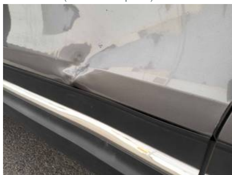
Porte avant gauche (Défaut aspect)