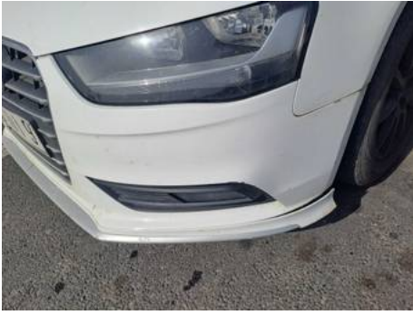
Bouclier avant (Rayure)