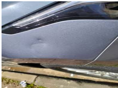
Aile avant droite (Impact)