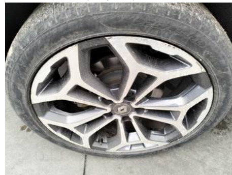
Jante alliage arrière droite (Rayure)