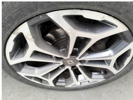
Jante alliage avant droite (Rayure)