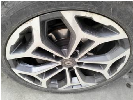
Jante alliage avant gauche (Rayure)