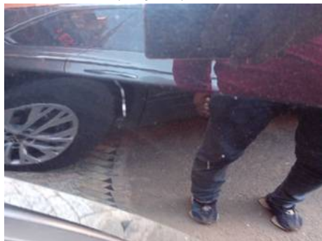
Porte arrière droite (Rayure)