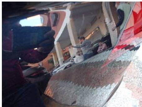
Aile arrière gauche (Rayure)