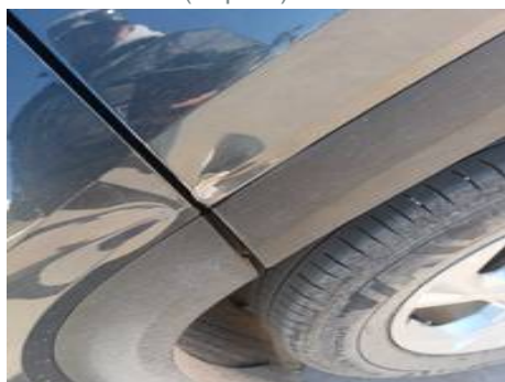
Aile arrière droite (Impact)