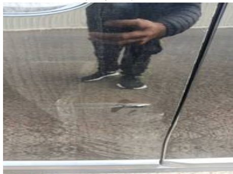
Porte avant gauche (Rayure)