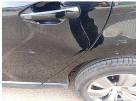
Porte arrière gauche (Rayure)