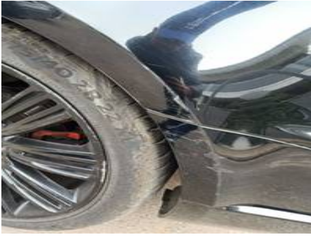
Aile arrière gauche (Rayure)