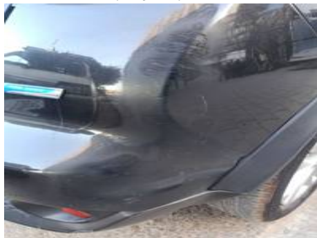
Bouclier arrière (Rayure)