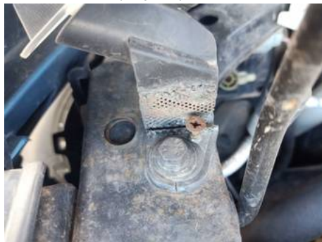
Phare avant droit (Impact)