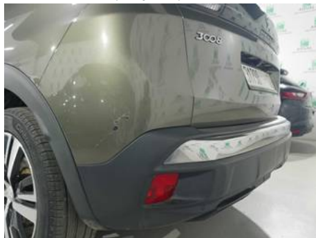
Bouclier arrière (Rayure)