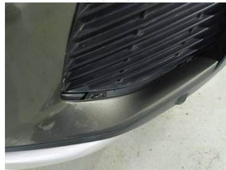
Bouclier avant (Impact)