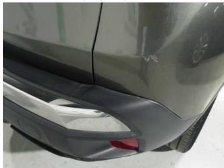
Bouclier arrière (Impact)