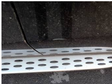
Porte arrière gauche (Rayure)