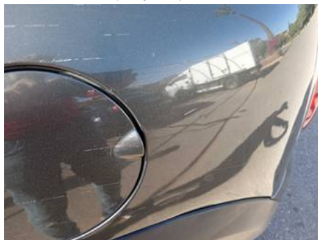
Aile arrière gauche (Rayure)