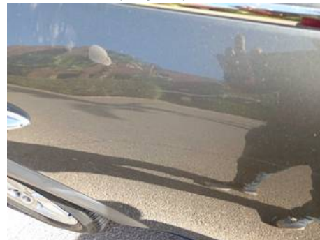
Porte arrière droite (Rayure)