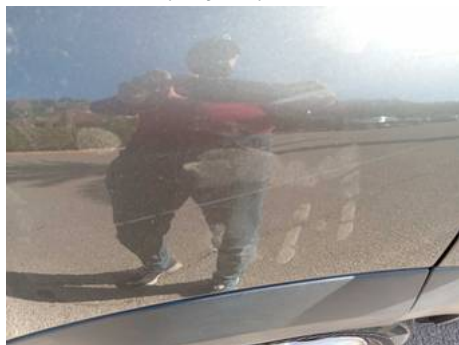
Aile arrière droite (Rayure)