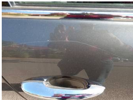
Porte avant droite (Rayure)