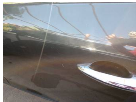
Porte arrière gauche (Rayure)