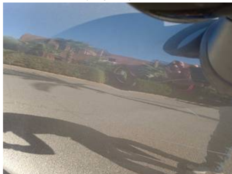
Porte avant droite (Impact)