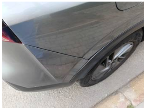
Aile arrière gauche (Impact)